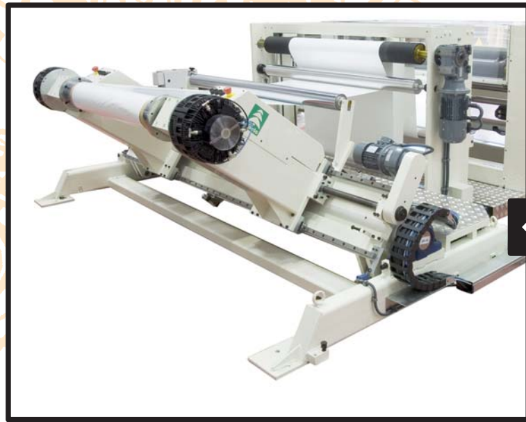
Desbobinador SHAFT-LESS Freno neumático y celulas de carga