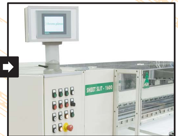
Automatic control of all machine functions